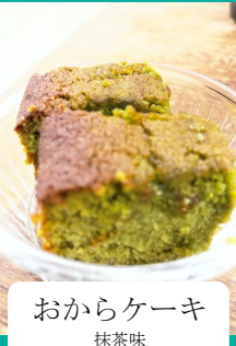
おからケーキ 抹茶味