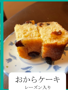
おからケーキ レーズン入り