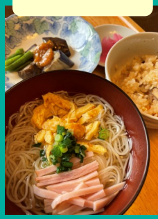
煮麺とかやくご飯